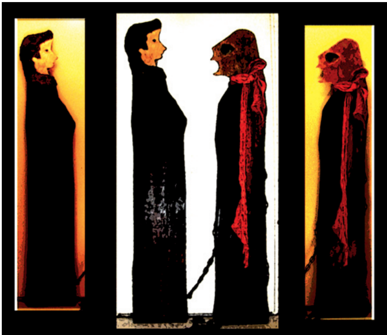
Walter Dorsch; La Belle et la Bête ; Buchenholz und Bronze, digital modifizierte Photographie auf Alu Dibond, 2013, 200 cm x 50 cm; 200 cm x 100 cm und 200 cm x 50 cm © Walter Dorsch

Ausstellung im Eisernen Haus im Nymphenburger Schlosspark in München, vom 25. bis 27. Juli 2025