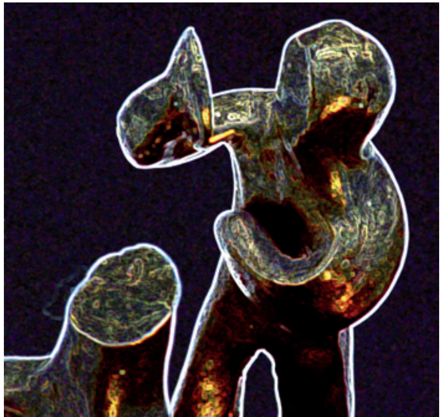
Walter Dorsch; Narziss; Bronze (2006), digital modifizierte Photographie auf Alu Dibond; 2010; 80 cm x 80 cm © Walter Dorsch

Dem gemeinsam von Christian Evers und Walter Dorsch entwickelten Ausstellungskonzept für die Präsentation im Eisernen Haus im Nymphenburger Schlosspark in München liegt die Erkenntnis zugrunde, dass häufig Zerrbilder über den oder die anderen im Kopf entstehen, solange Menschen nicht miteinander reden. Mit Bildern, Grafiken, Skulpturen und Texten aus dem archaischen Kollektiv unserer Geschichte hinterfragen die beiden Künstler auf kluge Weise – mal leise, mal plakativ – ebensolche Zerrbilder, Gefahren und Träume vom Glück. Die Kunstwerke beschreiben Frauenbilder, Zerrbilder, glückliche Paare und toxische Mannesbilder – dialektisch, fragend, erinnernd, humorvoll, passgenau – und treffen dabei direkt und unverstellt die aktuelle Weltlage: Mit den sieben Reichsten der Welt, die sich sinnbildlich alle in einem Boot vor der Sintflut retten; oder zur Vermehrung politischer Abrissbirnen; zur Frage, weshalb Cassandra ihr Wissen nicht mitteilen durfte; oder