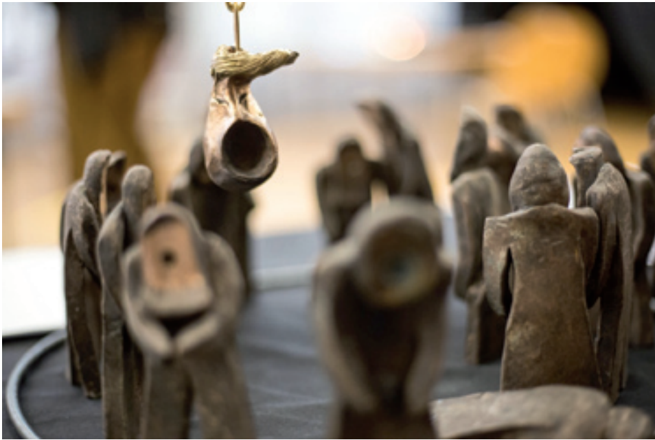
Walter Dorsch; America first! Donald Trump as wrecking ball and the obedient people ; bronze figures, digital modified photography, alu dibond; 2017; 45 cm x 60 cm © Walter Dorsch

Die von Christian Evers fernöstlich anmutende, poetisch tuschierte Landschaft im Hintergrund dieser Arbeit kommuniziert und verschmilzt mit dem ähnlich gestalteten Schilfrohr zu einer Einheit – im betörenden Kontrast zu den plakativen Pop-Blumen im Vordergrund und dem sich ins Bild beugenden, übergroßen Narziss,