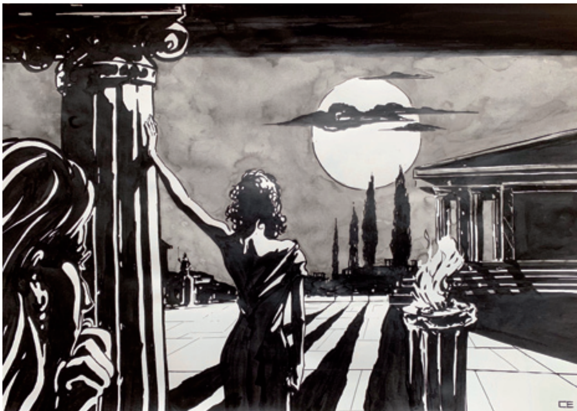
Christian Evers; Athena's Plan ; 2025, 60 cm x 40 cm, Tusche auf Papier, gerahmt © VG Bild-Kunst, Bonn 2025

aus der wunderschönen und betörenden Medusa jene Protagonistin mit dem gefährlichen Schlangenhaar werden konnte. Unrecht erlitt Medusa gleich doppelt, von einem Gott - Poseidon und einer Göttin - Athena. Poseidon hatte Athenas Tempel durch seinen Akt der Gewalt an der begehrten Medusa entweiht. Da Rache jedoch nicht an Poseidon selbst möglich war, verwandelte Athena Medusas schönes blondes Haar in Schlangen. Christian Evers porträtiert mit meisterlicher Linienführung die nach Rache sinnende Athena. Aus dem „Hinterhalt“ der linken Bildteilkulisse heraus scheint sie die selbst in Rückenansicht betörend schöne Medusa anzustarren, deren geschmeidiges Wesen ihren Zorn und ihre Eifersucht umso mehr steigert. Die Wandlung beginnt! Welch eine fantastische Tiefe und Perspektive ist Evers hier gelungen: Durch das charakteristische Merkmal des pointiert bewussten Auslassens von Farben und Konturen, um visuelle Reize zu setzen und seine Szenen „atmen“ zu lassen wird seine gerade-