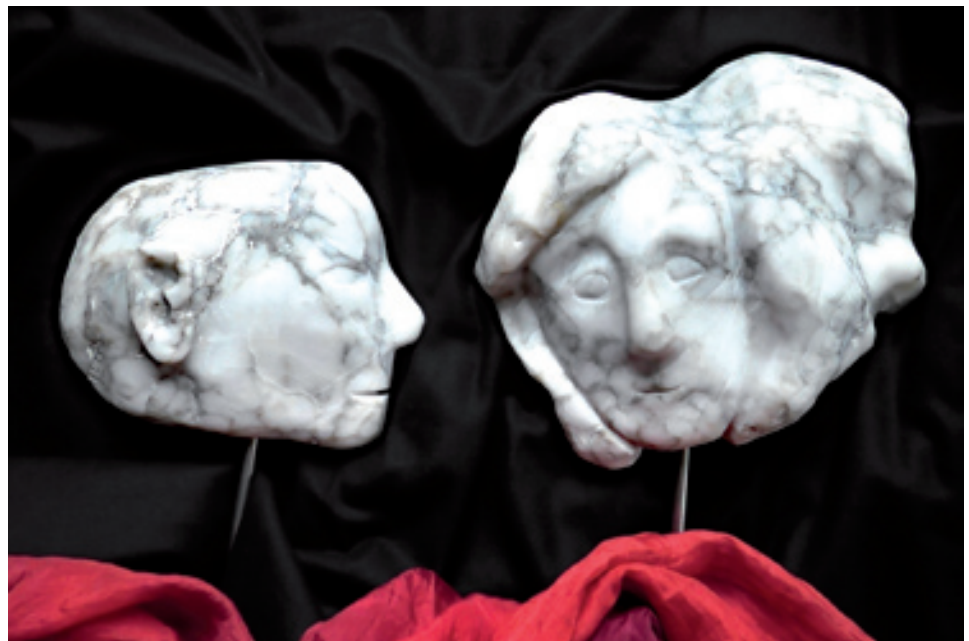
Walter Dorsch; Ungleiches Paar; 2023, Alabaster, 34 cm x 20 x 20 cm und 40 x 20 x 20 cm; auch Photographie © Walter Dorsch

wovor Leyla schreckliche Angst hat und weshalb sich ihr Schleier überhaupt löst; betrachtet wird, wie Susanne den lüsternen Alten entkam und Syrinx sich dem Vergewaltiger Pan entziehen konnte; oder: wie gut Frauen sich miteinander unterhalten können oder auch nicht - und weshalb Minervas Schwester ein wenig einfältig gewesen sein könnte. Wie anders wäre die Weltgeschichte wohl verlaufen, hätten Magdalena und andere kluge Frauen mehr Gehör gefunden? All dies stimmt nachdenklich, ebenso wie die bildhaften Anregungen, weshalb manche Gespräche einfach nicht gelingen und wie die Schöne sich hatte in das Biest verlieben können, was wir uns ja bei dem Triptychon von Walter Dorsch „La belle et la bête“ unmittelbar fragen. Was alles kann geschehen, nur weil ein Umstand falsch verstanden und das Missverständnis immer weitergetragen wird? Und doch gibt es sie, die glücklichen Paare – sie machen Mut